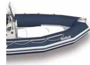
Sonnendecks Sunrider Sunrider 550-600-650-700