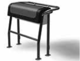
Grau-schwarzes Edelstahl-Bolster Z61237