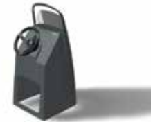
Optima 800 f. seitl. Montage Z61451