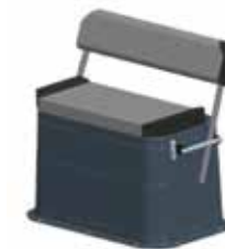
Sitzbank T4, kippbar Z61471