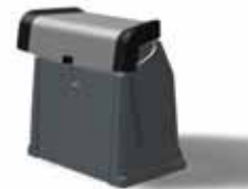
Grau-schwarzes Polyester-Bolster Z61236