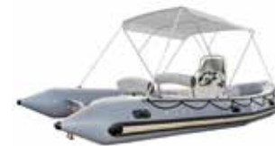
Biminis Explorer und Sunrider 550: Z1088 Explorer 600 und Sunrider 650: Z61113