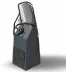
Optima 1000 mit 68 Liter-Tank Z61399

Die Ausstattungen sind unseren Booten perfekt angepasst; Ihr Händler wird Ihnen helfen, das für Sie ideale Ensemble zusammenzustellen, indem er die Elemente Ihren Vorstellungen oder Ihren Fahrvorlieben entsprechend platziert. (Zur Zusammenstellung der Explorer-Packs)