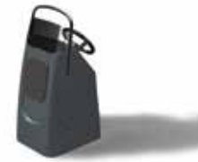
Optima 800 FTC Mit 68 Liter-Tank Z61452