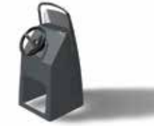
Optima 800 ohne Tank Z61450