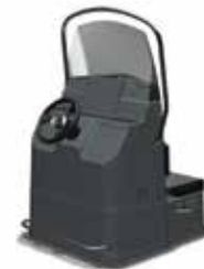
Konsole T4, ohne Tank Z61565 (für Explorer 690)