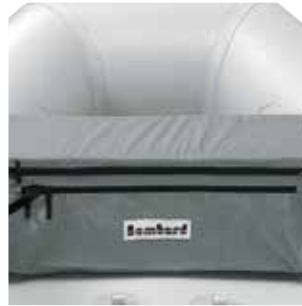
Sitzducht Tasche Z61134

Kompletieren und personalisieren Sie Ihr Boot oder Ihren Tender mit unabkömmlichen Accessoires, um Ihren Komfort an Bord zu optimieren. Ihr Händler berät Sie gern.