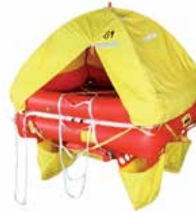
BIP COAST ISO 9650-2