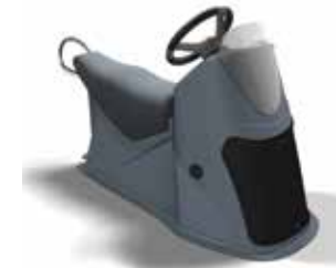
Graue Jockey-Konsole, 2-sitzig, ohne Tank Z61247