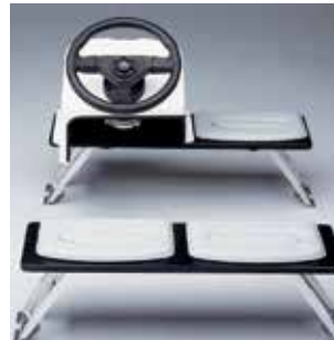
Mini-Konsole (Commando) Z1387