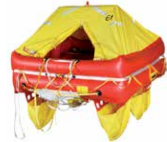
BIP OFFSHORE ISO 9650-1