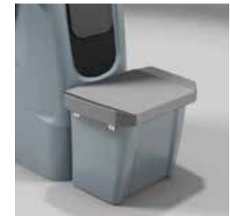
Sitzbank Mono, 1-sitzig Z61427