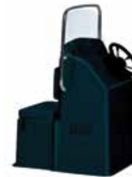
Graue Konsole mit Vordersitz + 100 Liter-Tank Z61243