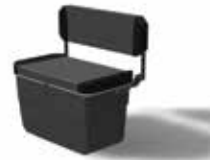
Sitzbank, 2-sitzig Z61212